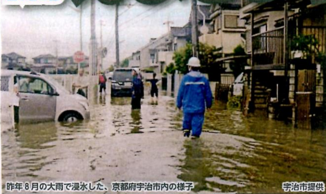
昨年8月の大雨で浸水した、京都府宇治市内の様子